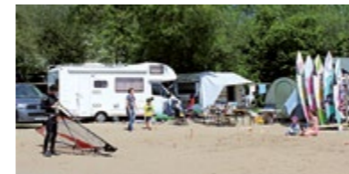
An verschiedenen Stellen im Camp gibt es Stellplätze mit Stromversorgung.