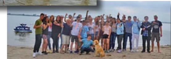
„Wir sind im nächsten Jahr wieder dabei!“