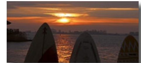
„Allein schon wegen dieser Abende ...“ (Gabi)