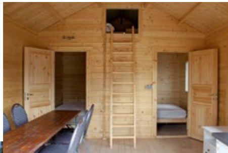
Das Blockhaus: 2 Schlafzimmer mit Doppelbett, 2 Betten unter dem Dach für Kids